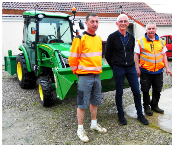
Livraison du tracteur le 14 mai, outil indispensable pour nos employés !