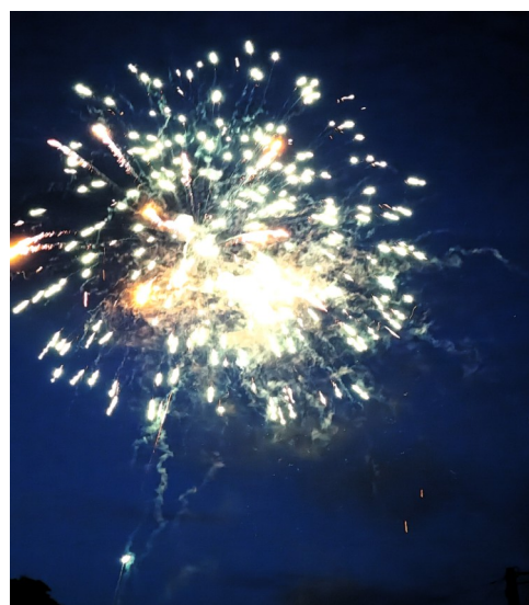
Apéritif concert animé par Valérie Masset, restauration , bal dans la salle des fêtes et feu d'artifice.....