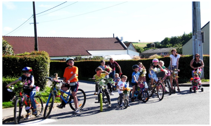
Défilé de vélos fleuris, le 13 juillet, ouvert à tous les enfants ...