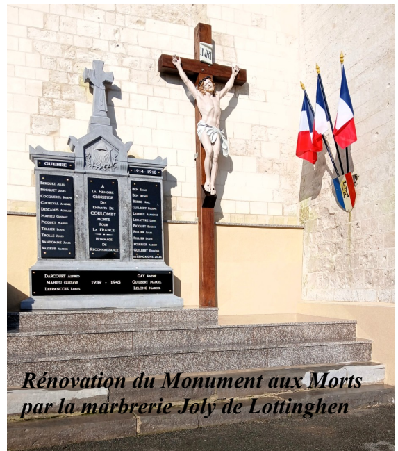
Rénovation du Monument aux Morts par la marbrerie Joly de Lottinghen