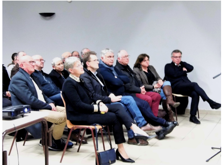
Vœux du Maire à la population, le 26 janvier 2024