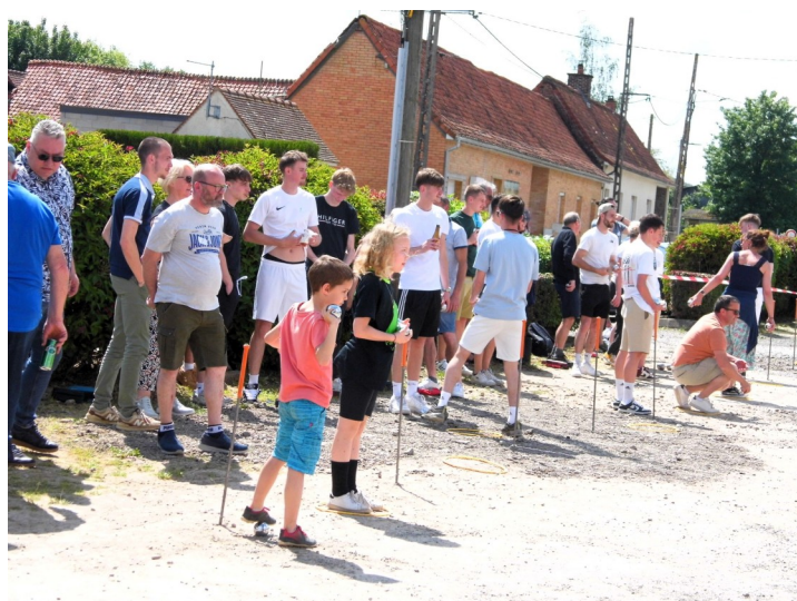
Concours de pétanque, le 25 mai, organisé par l'US Coulomby, sur la place du village.