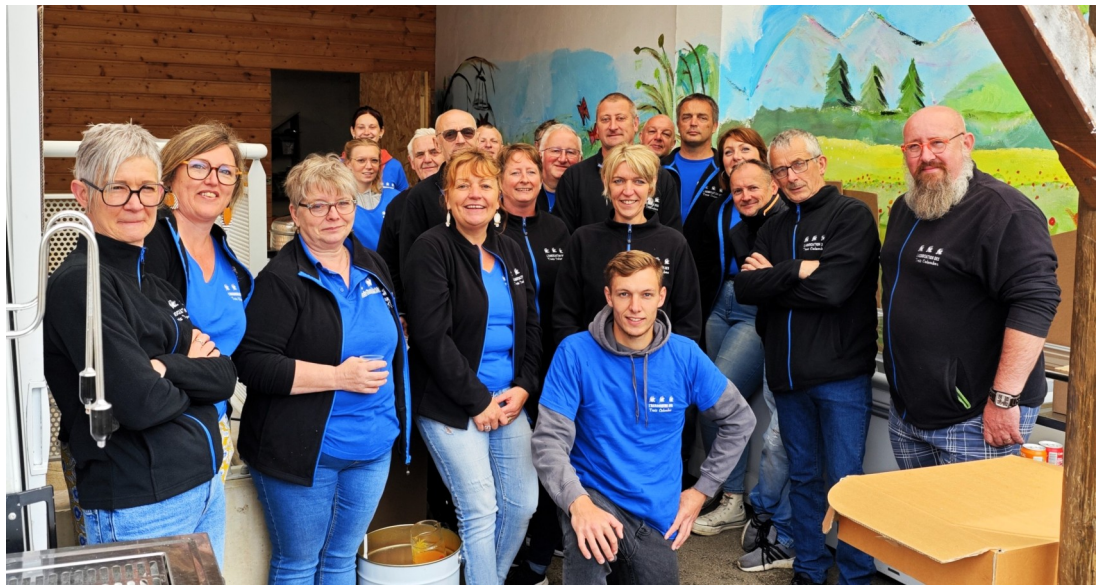
Une partie des membres de l'Associaton les Trois Colombes, le 7 juillet.....