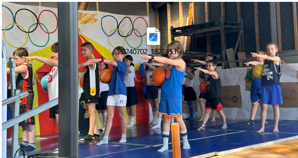
Kermesse du RPI le 23 juin à Seninghem