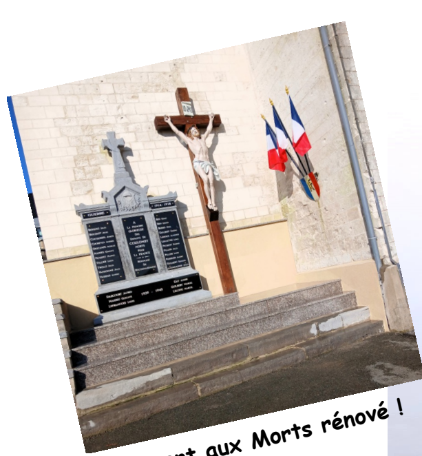
Monument aux Morts rénové !