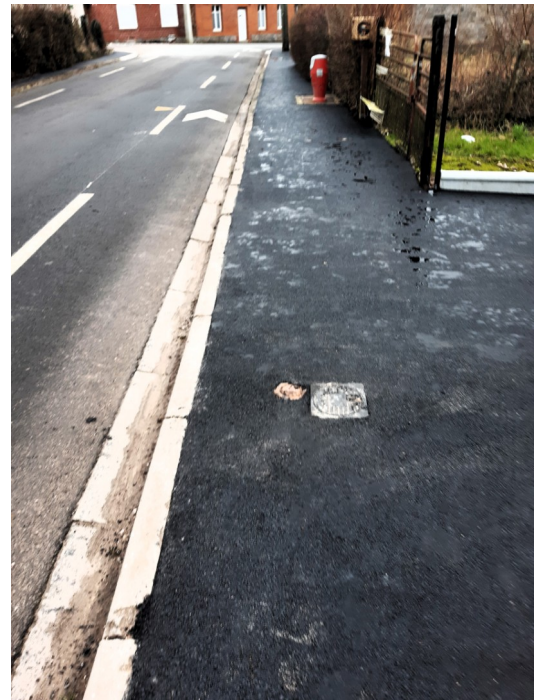
Réfection des trottoirs, rue Principale